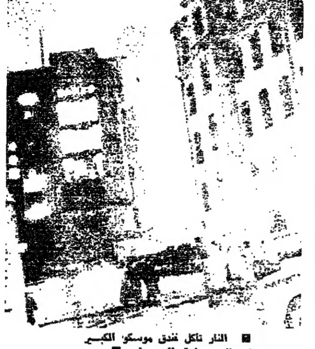
النار تاكل فندق موسكو الكبر في الساعة الحمراء

تحتك السلطات السوفياتية على احصاء الاصابات في حريق استمر بست ساعات في فندق موسكو وكسرت تقديرات غير رسمية ان ١٨ شخصا على الاقل قتلوا فيه. صرح طبيعياح المساهمين للصحفيين الغربيين انه يعتقد ان عدد القتلى والجرى قد يصل الى ١٦٠. واشارت اتصالات مع ١٢ سفارة غربية الى انه كان هناك حوالي ٥٠٠ نزيل غربي معظمهم من رجال الاعمال في الفندق الذي يقول الروس انه اكبر فندق في العالم. ولكن الدبلوماسيين يعتقدون انهم رعاياهم ساكنون. فكرت وكالة انباء «تاس» ان التقرير الاولية تبين ان سبب الحريق يعود الى خلل في اجهزة الصمامات. ولحق كبر الضعف بالتفجيرة العلوية في الجناح الشمالي المؤلف من ١٢ طبة ويتكافئ الفندق من ٦٠٠٠ غرفة. موسكو - ر